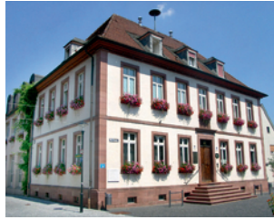
Rathaus am Marktplatz

Während der Blütezeit der Stadt entstanden viele schöne Adels- und Patrizierhäuser, die vor allem in der Amtsgasse und am Marktplatz noch heute das Stadtbild prägen.