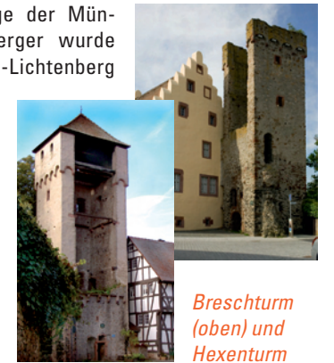
Breschturm (oben) und Hexenturm

Die Stadt selbst war durch eine starke Ringmauer mit Türmen geschützt, von denen der Hexenturm, das Wahrzeichen der Stadt, und der Breschturm noch erhalten sind.