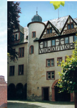
Innenhof des Schlosses

Babenhausen ist Bahnknotenpunkt der Strecken Darmstadt-Aschaffenburg und Hanau-Odenwald. Autobahnen und ihre Zubringer führen nahe an das Stadtgebiet von Babenhausen heran.